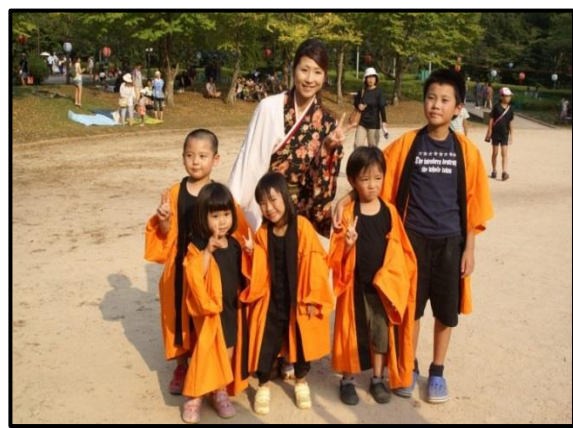
ゆいまーるキッズデビュー!